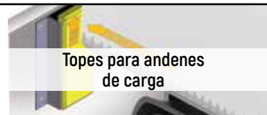
Topes para andenes de carga