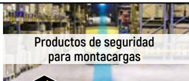
Productos de seguridad para montacargas