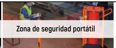
Zona de seguridad portátil