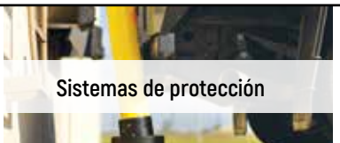
Sistemas de protección