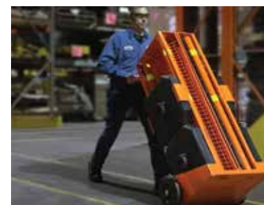
FÁCIL DE TRANSPORTE

La zona de seguridad portátil Ideal Warehouse Innovations es una solución posible para cumplir con esta norma de seguridad de la OSHA: 1910.212[a][1] Se deben implementar uno o más métodos de protección de máquinas para proteger al operador y a otros empleados en el área de máquinas contra ciertos peligros, como los generados por el punto de operación, los puntos de atrapamiento, las piezas giratorias, las esquirlas que pudieran salir despedidas y las chispas. Entre los ejemplos de métodos de protección, se incluyen los protectores de barrera, los dispositivos de activación mediante dos manos y los dispositivos de seguridad electrónicos, entre otros.*