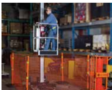
PROTEJA AL PERSONAL DE MANTENIMIENTO Y SERVICIO