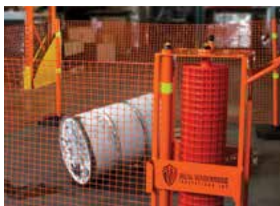
ASEGURE UNA ZONA PELIGROSA TEMPORAL