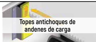
Topes antichoque de andenes de carga