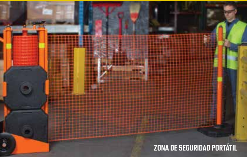
ZONA DE SEGURIDAD PORTÁTIL