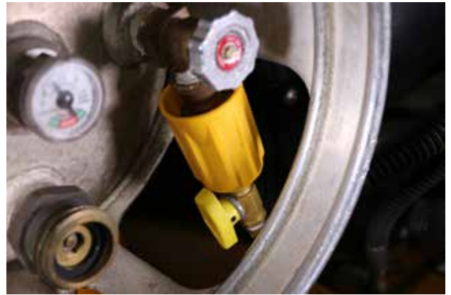
VÁLVULA DE CAMBIO RÁPIDO PARA PROPANO EN USO

El operador del elevador de horquillas puede llevarse una gran sorpresa al cambiar un tanque de GPL (gas propano líquido). El sello de la válvula del tanque puede fallar y hacer que el gas propano se rocíe sobre la mano o el rostro antes de que el operador pueda reaccionar. El propano líquido se evapora rápidamente (-42 °C o -44 °F) y causa quemaduras por congelamiento graves si entra en contacto con la piel. Casi todos los operadores de elevadores de horquillas han tenido alguna experiencia negativa con el propano líquido y no les gusta ser afectados por el GPL.