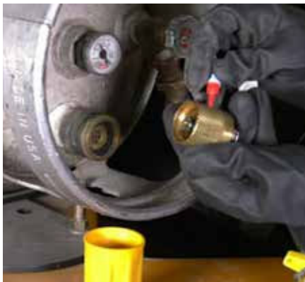
PONGA PEGAMENTO EN EL ACOPLE Y EL MANGO DE SEGURIDAD