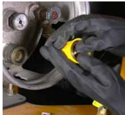
EMPUJE EL ACOPLE POR EL MANGO DE SEGURIDAD