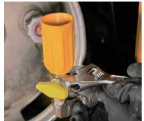
INSTALE EL ACOPLE EN LA VÁLVULA DE PROPANO CON UNA LLAVE