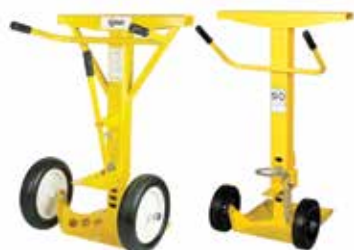
AUTOSTAND PLUS ET AUTOSTAND Béquille solide. Tout simplement.

Nos béquilles de sécurité pour remorque traditionnelles.