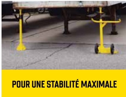
POUR UNE STABILITÉ MAXIMALE