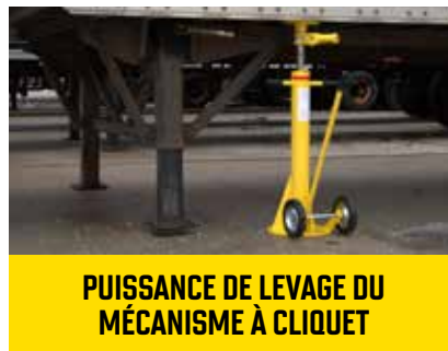
PUISSANCE DE LEVAGE DU MÉCANISME À CLIQUET