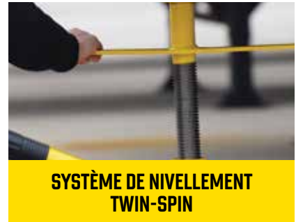
SYSTÈME DE NIVELLEMENT TWIN-SPIN