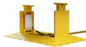
BÉQUILLE DE SÉCURITÉ POUR REMORQUE MONTÉE AU SOL* L'ultime. Bouton-poussoir facile

Gérez l'efficacité de votre quai avec la béquille de sécurité pour remorque convenant parfaitement à vos besoins.