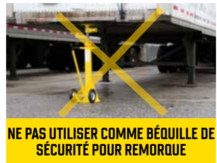
NE PAS UTILISER COMME BÉQUILLE DE SÉCURITÉ POUR REMORQUE