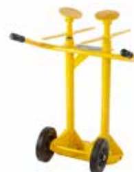
BÉQUILLE POUR REMORQUE À DEUX COLONNES Béquille ergonomique solide.