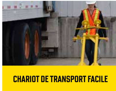
CHARIOT DE TRANSPORT FACILE