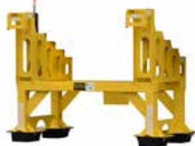
SHUNTABLE 2.0 Notre option No Boots on the Ground® facile à ranger.