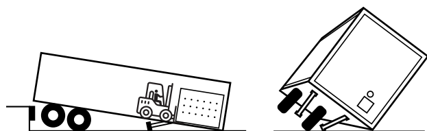
L'effondrement de la béquille et le renversement de la remorque mettent les travailleurs et les installations en danger.