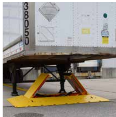
OPERACIÓN CON BOTÓN