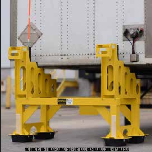
NO BOOTS ON THE GROUND® SOPORTE DE REMOLQUE SHUNTABLE 2.0