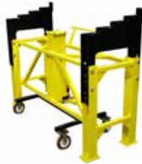
AUTOSTAND WIDE Fácil de desplegar, ergonómico y fuerte.

Soporte extra ancho y muy fácil de usar.