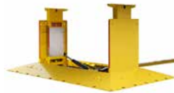
SOPORTE DE REMOLQUE MONTADO EN TIERRA* Lo mejor. Con solo pulsar

Opere su muelle con eficiencia usando el soporte de remolque más apropiado para sus necesidades.