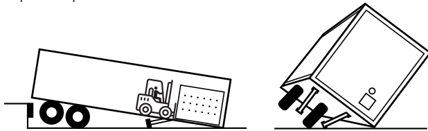
El colapso del tren de aterrizaje y el vuelco del remolque ponen en riesgo a los trabajadores y las instalaciones.