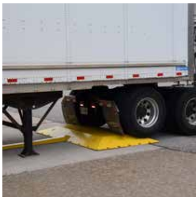
INSTALACIÓN SENCILLA, POSICIONAMIENTO PERMANENTE

Una opción totalmente automatizada y resistente para entornos de muelles de carga ajetreados.