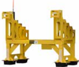
SHUNTABLE 2.0 Nuestra opción No Boots on the Ground® de fácil almacenamiento.