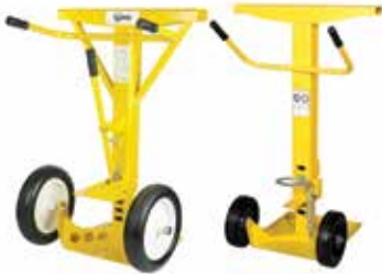
AUTOSTAND PLUS Y AUTOSTAND Soporte sólido. Muy simple.

Nuestros tradicionales soportes de remolque.