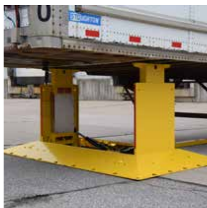
AUTOAJUSTABLE A CUALQUIER ALTURA DE REMOLQUE